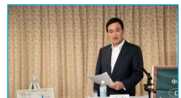
小里泰弘 国土交通部会長 『安心・安全 活力ある社会へ ー現場や暮らしに届く政策づくりー』