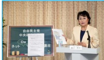
猪口邦子 内閣第一部会長 『新型コロナウイルス感染症がもたらす国際政治の課題と国内少子化対策の課題』