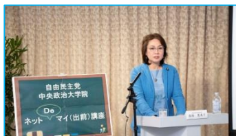
高階恵美子 文部科学部会長 『文教科学・スポーツ文化関係の 支援策』