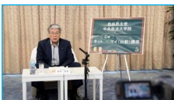
野村哲郎 農林部会長 『農林分野でのコロナ対策』