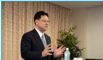
関 芳弘 内閣第二部会長 『省庁横断案件を取り扱う 内閣第二部会』