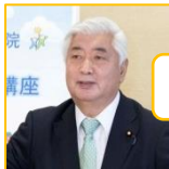
中谷 元 学院長

「新型コロナウイルスがこれからの国際社会にどのような影響を与えるか」をテーマに、インターンシップ実習生 OBOG を対象に行いました。学生から社会人まで、遠くは北海道や九州からも参加しました。