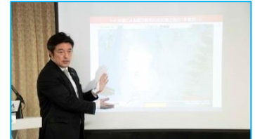
中山泰秀 外交部会長 『ゲームチェンジャー 新型コロナウイルスの素顔とは?』