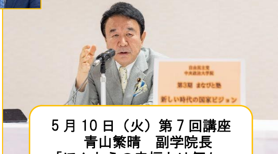
5月10日(火) 第7回講座 青山繁晴 副学院長 「ほんとうの幸福とは何か」