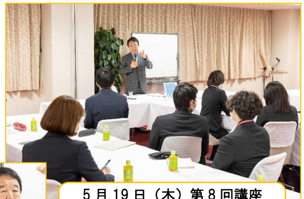
5月19日(木) 第8回講座 青山繁晴 副学院長 「世界が壊れ日本が屹立する」