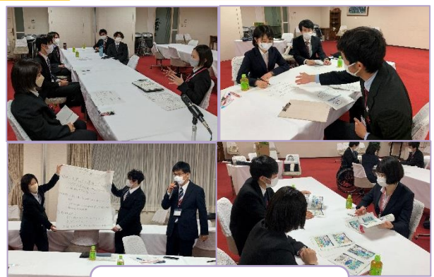
ディスカッション