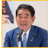
【挨拶】下村博文 学院長