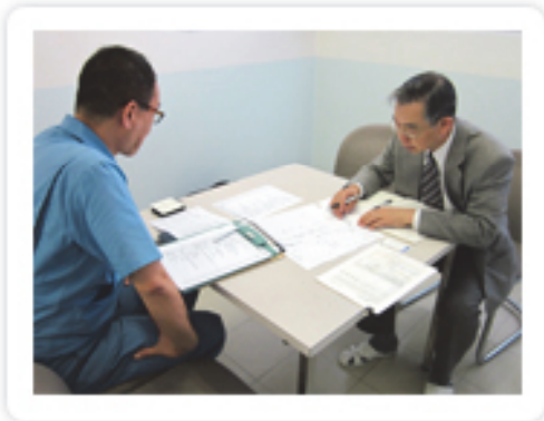
エネルギーの使用状況をヒアリング