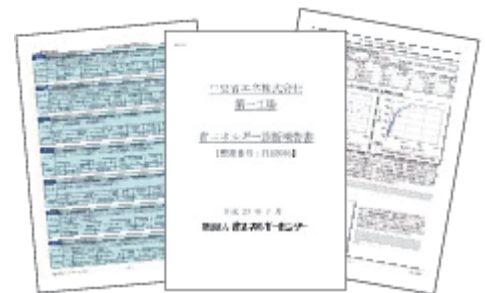
診断報告書を提出