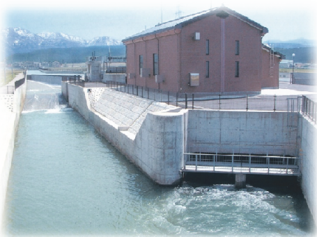
七ヶ用水発電所(石川県・手取川水系手取川)