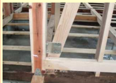
柱脚固定金物、筋交いプレートの追加