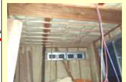
外壁の断熱材充填