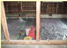
防湿コンクリート下の防湿シート敷込