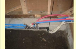
さや管ヘッダー方式